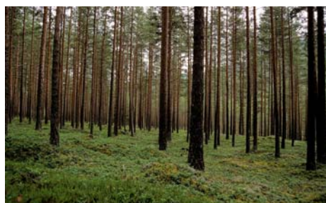
Les forêts boréales émettent des composés terpénoïdes dont l'oxydation génère des grandes quantités d'acide formique.