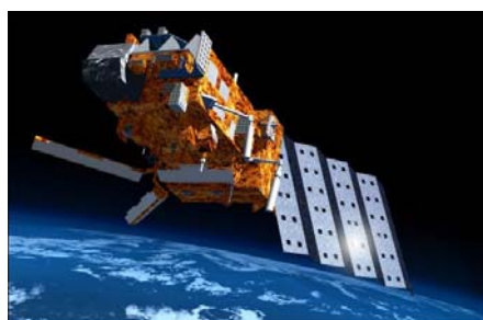
Le satellite MetOp lancé fin 2006. L'instrument IASI est localisé par une flèche